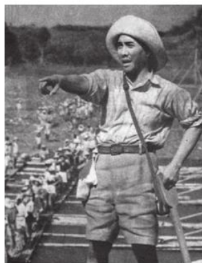
Gambar 3.11. Sukarno saat memimpin para romusha sukarela.

Kutipan di atas dijelaskan bahwa terdapat pemimpin yang kuat, beliau bahkan berkali-kali memimpin perlawanan terhadap Belanda, sosok pemimpin tersebut adalah Pangeran Antasari. Pangeran Antasari merupakan sepupu dari Pangeran Hidayatullah yaitu dari Kesultanan Banjar. Pangeran Antasari merupakan pencetus dari Perang Banjar. Perang ini merupakan perang sengit yang ada di Kalimantan Selatan dalam menghadapi pemerintahan Belanda. Dalam perkembangannya, perjuangan Pangeran Antasari melawan pemerintah kolonial Belanda tidaklah mudah. Akan tetapi, meskipun kegigihan dan perjuangannya memimpin perlawanan, Pangeran Antasari mengalami kekalahan akibat jatuh sakit. Sehingga Belanda berhasil menguasai Kalimantan Selatan dan menghapuskan kesultanan Banjar.