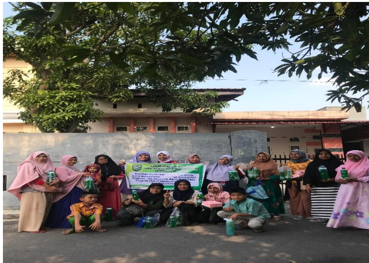
Gambar 4 : foto bersama setelah kegiatan pelatihan selesai

Selama ini program pemberdayaan masyarakat hanya berupa penyuluhan dan sifatnya lebih ke teori. Kegiatan berupa pelatihan ini diharapkan ibu-ibu bisa memanfaatkan waktu luang yang bisa menghasilkan tambahan penghasilan keluarga. Buk istinab selaku koordinator PKH juga berharap kedepannya akan ada lagi bantuan dari pihak-pihak lainnya demi bertambahnya keterampilan ibu-ibu kelompok Program Keluarga Harapan (PKH) dan bisa mandiri secara ekonomi