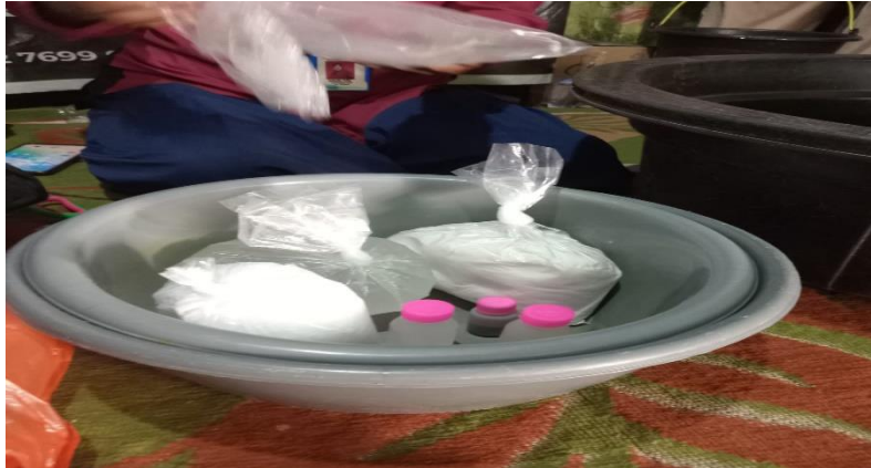
Gambar 2 : pemberian bantuan bahan – bahan pembuatan sabun cuci piring kepada ibu- ibu kelompok melati putih

memberikan pelatihan praktis dalam pembuatan sabun cuci piring, mempromosikan produk lokal, dan membangun jaringan kerja sama antar-pelaku usaha.