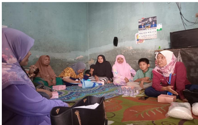
Gambar 1: pemaparan materi tentang ekonomi kreatif oleh ketua serta anggota PKM

Langkah awal kegiatan pengabdian kepada masyarakat ini yakni pemaparan materi tentang ekonomi kreatif dan bagaimana memiliki keterampilan untuk bisa menambah pendapatan keluarga. Hal ini dilakukan untuk menambah pengetahuan dan keterampilan,