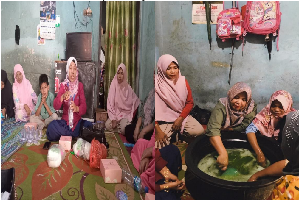
Gambar 3 : ibu – ibu kelompok melati putih sedang melakukan pelatihan pembuatan sabun cuci piring

Pengadaan bahan – bahan pembuatan sabun cuci piring mulai dari bahan seperti Texapon, Natrium sulfat, Pewarna, EDTA, NaCl, Foam Boster, Camperlan, Gliserin, parfume, dan Air.. Barang – barang yang diserahkan ini tentunya akan memudahkan ibu- ibu kelompok melati putih dalam melaksanakan pelatihannya.