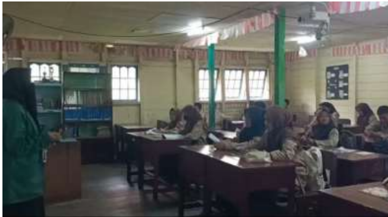
Gambar 1. Perencanaan PKM

Tahap awal pelaksanaan kegiatan pembinaan ini dilakukan dengan perencanaan. Pada tahap ini, dilakukan observasi dan analisis terhadap perilaku remaja di lingkungan sasaran pengabdian untuk mengetahui tingkat pemahaman mereka terhadap etika digital. Hasil analisis menunjukkan bahwa sebagian besar remaja belum memiliki kesadaran penuh terhadap penggunaan teknologi secara islami. Oleh karena itu, tim pengabdian menetapkan tujuan kegiatan, yaitu menanamkan nilai-nilai Qur'an dan Hadis agar menjadi pedoman moral dalam berinteraksi di dunia digital. Materi yang digunakan diambil dari ayat-ayat dan hadis-hadis tentang adab pergaulan, kejujuran, amanah, dan tanggung jawab, seperti QS. Al-Hujurat: 11–12, QS. An-Nur: 30–31, serta hadis Rasulullah saw tentang etika berkomunikasi dan menjaga kehormatan. Materi yang disampaikan dalam kegiatan ini mencakup tiga pokok utama yang relevan dengan kehidupan remaja. Pertama, peserta diberikan pemahaman mengenai dampak negatif pernikahan dini dari berbagai aspek, termasuk kesehatan, pendidikan, dan sosial.