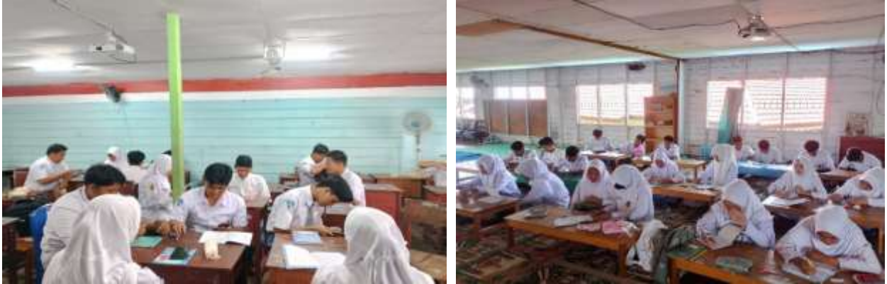
Gambar 2. Pelaksanaan PKM

Setelah melakukan kegiatan perencanaan kemudian kegiatan pembinaan ini dilakukan dengan tahap pelaksanaan. Tahap pelaksanaan dilakukan melalui tiga pendekatan utama, yaitu kognitif, afektif, dan psikomotorik. Pendekatan kognitif dilakukan melalui kegiatan kajian tematik Qur'an dan Hadis, diskusi interaktif, serta pemutaran video edukatif yang mengangkat isu-isu akhlak remaja di era digital. Kemudian peserta didik diajak memahami bagaimana nilai-nilai Islam dapat dijadikan pedoman dalam penggunaan media sosial, berkomunikasi, dan mengelola waktu di dunia maya. Selanjutnya pendekatan dilakukan dengan pendekatan afektif yang dilaksanakan melalui kegiatan muhasabah, tadabbur Al-Qur'an, dan sharing session bersama mentor muda. Melalui kegiatan ini, remaja diajak untuk mengenal kembali jati diri mereka sebagai generasi Muslim yang memiliki tanggung jawab moral dalam menjaga kehormatan diri di ruang digital. Kemudian pendekatan terakhir dalam pembinaan ini dilakukan dengan pendekatan psikomotorik yang diwujudkan dalam bentuk kegiatan nyata, seperti para peserta didik membuat suatu proyek yaitu pembuatan sebuah konten sedekah seperti video dakwah pemanfaatan media digital, atau membuat proyek pembuatan konten dakwah kreatif bertema akhlak yang mengandung pesan moral dari Qur'an.