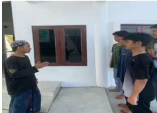
Gambar 3. Evaluasi PKM

Tahap terakhir dari Internalisasi pembinaan akhlak remaja berbasis Qur'an dan hadis dalam menghadapi tantangan era digital dilakukan melalui berbagai macam metode seperti observasi langsung terhadap perubahan sikap para peserta didik, penilaian diri sendiri seperti penilaian dari sikap jujur dan terbuka oleh masing-masing individu, serta dialog terbuka dalam forum diskusi kelompok yang bersifat reflektif di mana peserta didik bersama-sama mengulas pengalaman mereka. Kemudian tahapan evaluasi dalam pembinaan ini adalah melihat bagaimana pembinaan yang dilakukan dapat berdampak pada cara peserta didik menggunakan teknologi. Para peserta didik menyatakan bahwa kegiatan ini tidak hanya memberikan pengalaman yang sangat berharga, tetapi juga menumbuhkan kesadaran baru mengenai bagaimana mengaplikasikan teknologi secara bertanggung jawab dan selaras dengan nilai-nilai Islam dan menegaskan bahwa penggunaan teknologi harus diimbangi dengan etika, keimanan, dan pemahaman yang holistik terhadap tujuan jangka panjang.