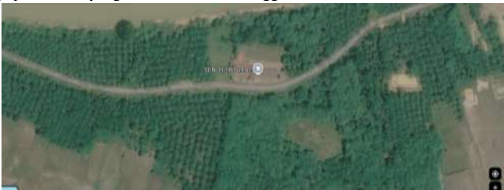
Gambar 1. Lokasi SD Negeri 039/IX Tantan dari satelit Google

Data orientasi geografis menunjukkan bahwa tata letak bangunan SD Negeri 039/IX Tantan berada pada posisi yang kurang strategis dari sudut pandang aksesibilitas transportasi harian masyarakat. Meskipun secara administratif sekolah ini terletak di wilayah perbatasan antara dua dusun, namun akses jalan menuju ke lokasi sekolah dinilai menyulitkan bagi sebagian besar warga sekitar. Pemetaan wilayah tangkapan ( catchment area ) menunjukkan terdapat delapan Rukun Tetangga (RT) yang berada di sekitar lingkungan sekolah, namun mayoritas warga dari enam RT di antaranya lebih memilih jalur akses lain. Kondisi infrastruktur jalan dan jarak tempuh yang dinilai kurang efisien memicu keputusan orang tua untuk mengalihkan orientasi sekolah anak-anak mereka ke lembaga pendidikan yang berada di dusun tetangga.